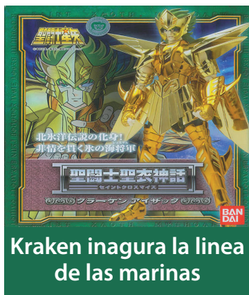
Kraken inaugura la línea de las marinas