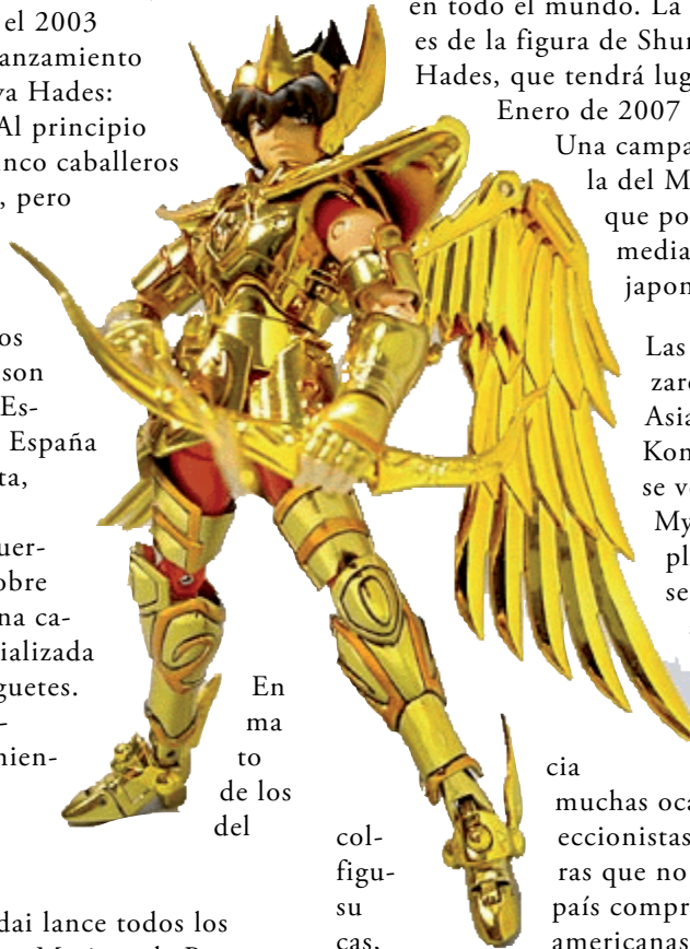
En ma to de los del

Periódicamente, Bandai prepara campañas en las que se comercializa una figura que en un principio no se pone a la venta, pero que se puede conseguir mediante el envío