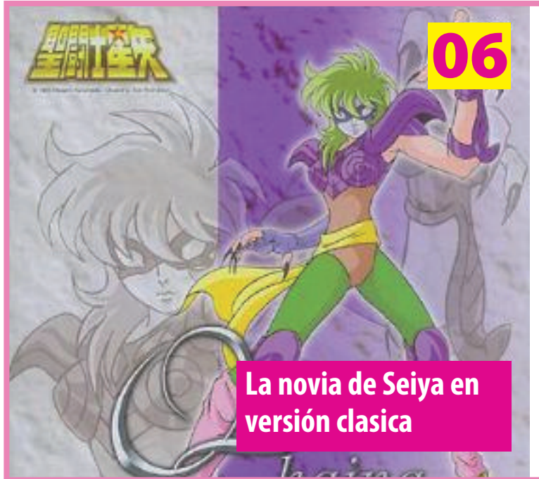
La novia de Seiya en versión clásica